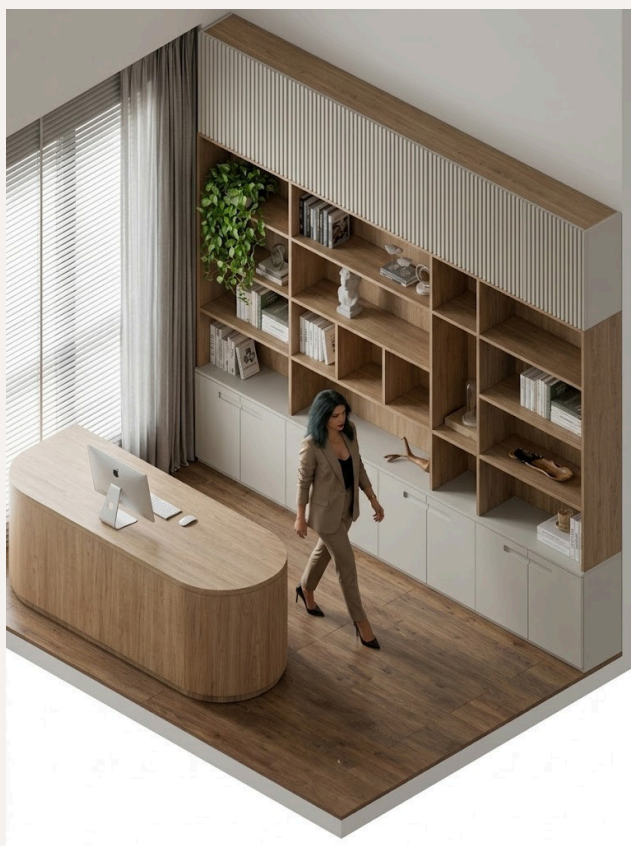
imagem 01 formato 9:16 1080 x 1920